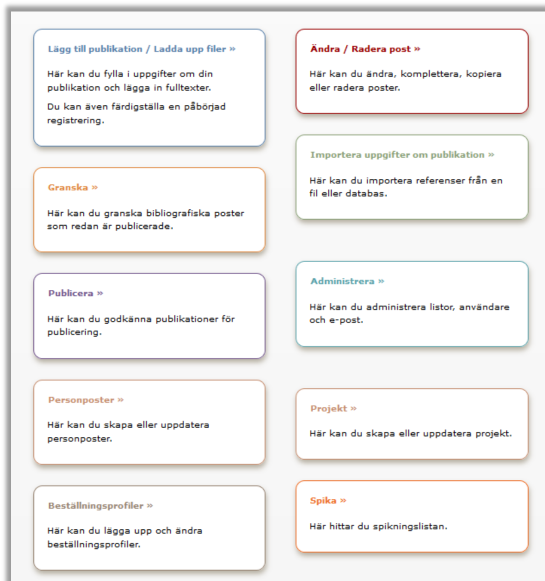
Figur 3. Funktioner i DiVAs administrativa gränssnitt som här visas med inloggning som "domainadmin".