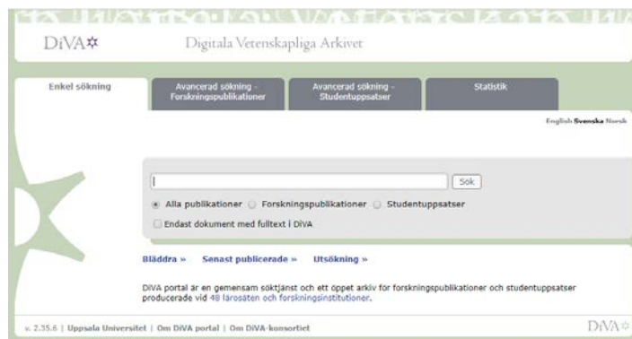
Figur 1. DiVA-konsortiets gemensamma sökportal DiVA portal: http://www.diva-portal.org/

För alla anslutna finns också en separat testingång, skild från driftmiljön, som kan användas i utbildnings- och övnings syfte eller för att testa nya funktioner. Alla webbsidor kan visas på svenska, norska eller engelska beroende på språkval eller webbläsarens inställningar. För sökning finns dels ett enkelt fritextbaserat formulär dels avancerade formulär med avgränsningsmöjligheter för forskningspublikationer respektive studentuppsatser. Det finns också hierarkiska, trädbaserade bläddringsgränssnitt för organisation, serier och ämneskategorier.